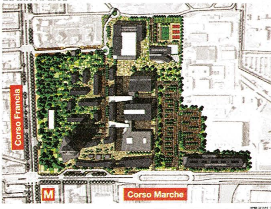
La nuova area

2010 È la data che i manager di Alenia si sono dati per completare il trasloco dello stabilimento da corso Marche a Caselle. La mappa del futuro quartiere