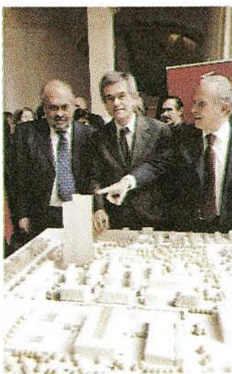
LA PRESENTAZIONE Il plastico in Municipio

«vorremmo sapere qualcosa di più. Ad esempio l'ala del superjet da caccia F35 in costruzione a Cameri potrebbe essere destinata a Torino. Questo sarebbe un vero segnale di rilancio». Senza dimenticare i cugini di Thales Alenia Space,